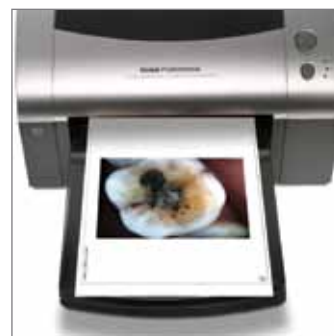
Imprima la imagen en cualquier tipo de impresora.